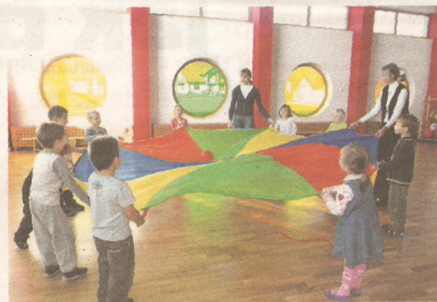
Maluchy jeszcze oswajają się z obiektem

W nowym przedszkolu jest miejsce dla aż 200 dzieci